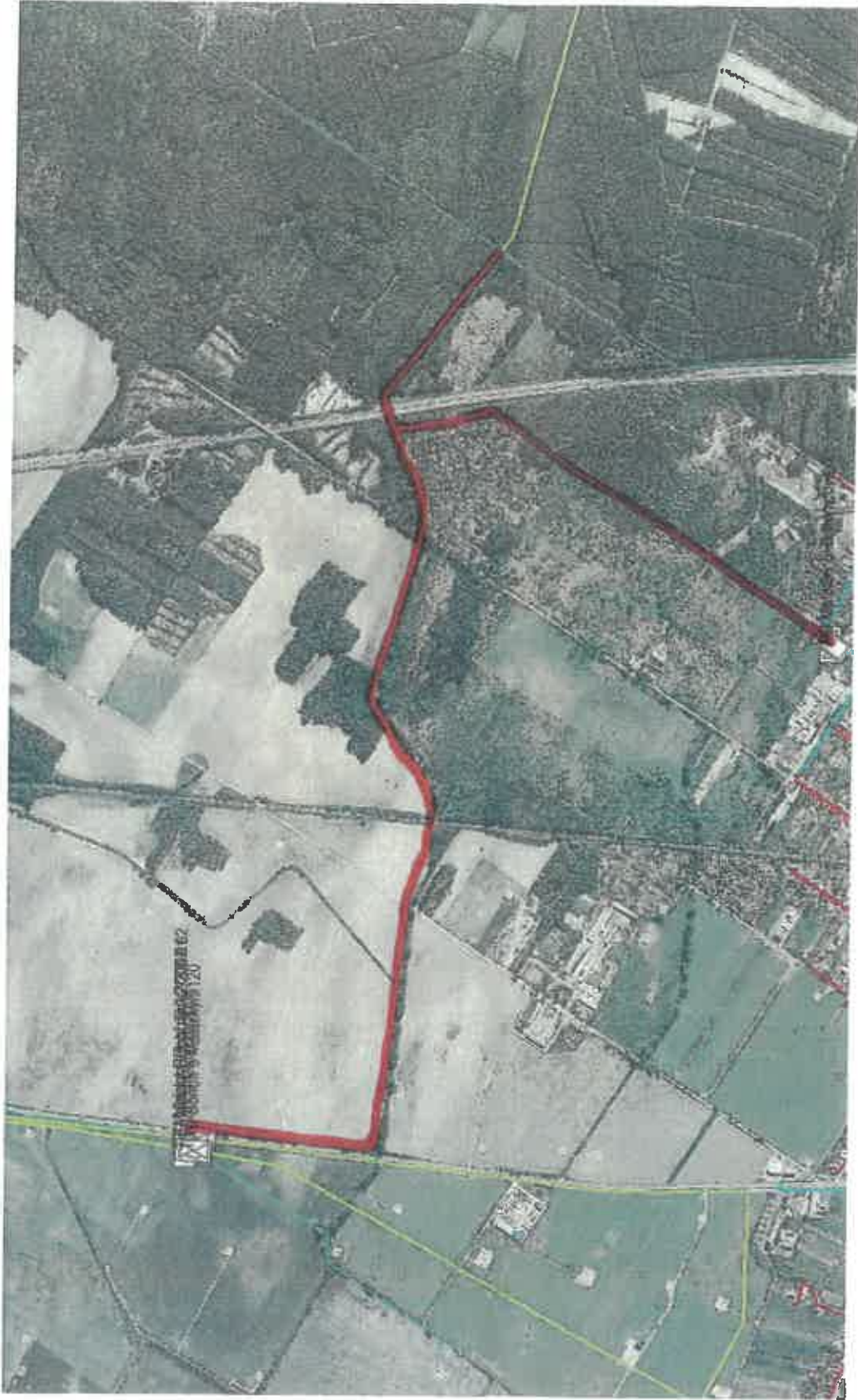
VTL plynovod DN 500 PN 40 k. u. Malacky